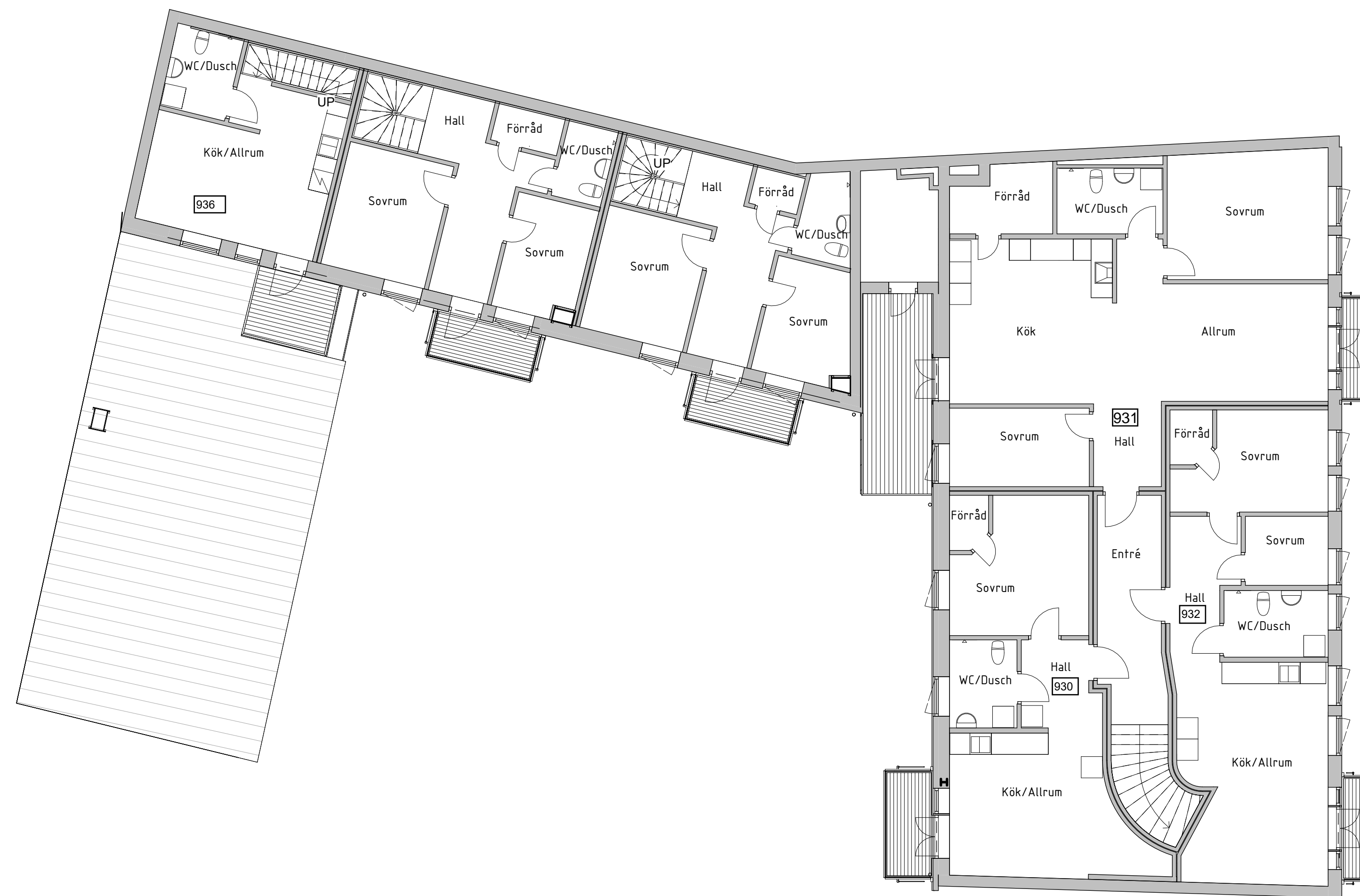
A - Plan 2 A SKALA 1:100